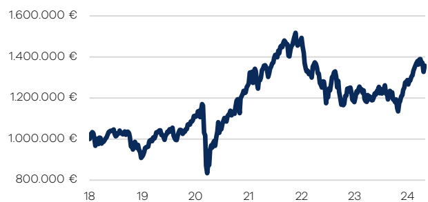
einer Investition von 1.000.000 Euro am 01.01.2018